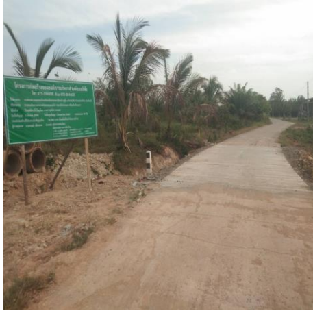
ภาพถ่ายโครงการวางท่อคสล.ถนนคอนกรีตเสริมเหล็กสายไร่ใหญ่ - ฟุ่งหน้าถ้ำ หมู่ที่ ๑ บ้านลิพัง ข้อบัญญัติปีพ.ศ. ๒๕๖๖