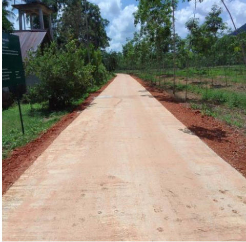
ภาพถ่ายโครงการก่อสร้างถนนคอนกรีตเสริมเหล็กสายวังไต่ะหมุ่ม หมู่ที่ ๖ บ้านหินจอก ข้อบัญญัติปีพ.ศ. ๒๕๖๖