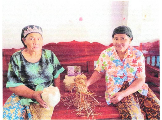
ผลิตภัณฑ์จากเตยปาหนัน