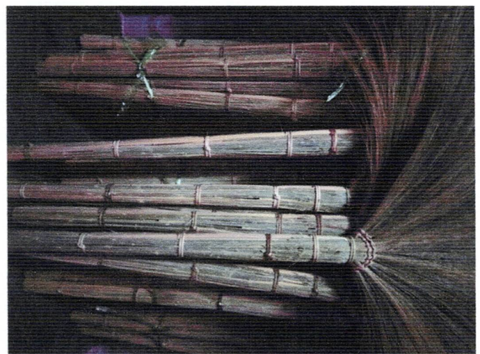
ผลิตภัณฑ์ไม้กวาดดอกหญ้า