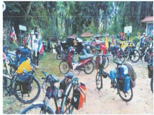
นักท่องเที่ยวนำมาเล่นน้ำ และส่องแก่ง