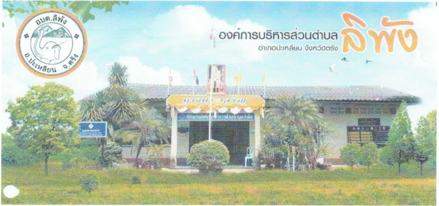
องค์การบริหารส่วนตำบลลิพอง ที่อยู่ หมู่2 ถ.ค