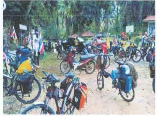
นักท่องเที่ยวมาเล่นน้ำ และล่องแก่ง